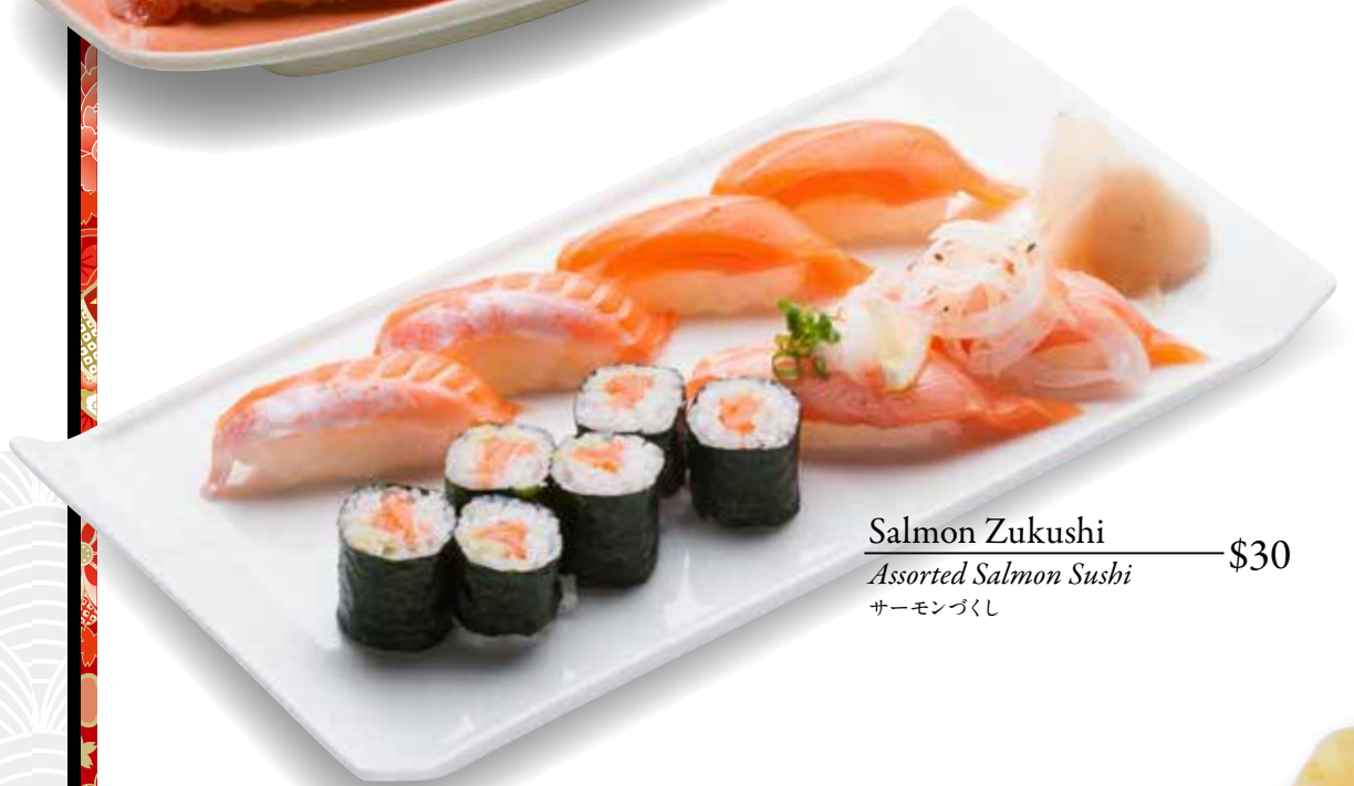
Salmon Zukushi — $30 Assorted Salmon Sushi サーモンづくし