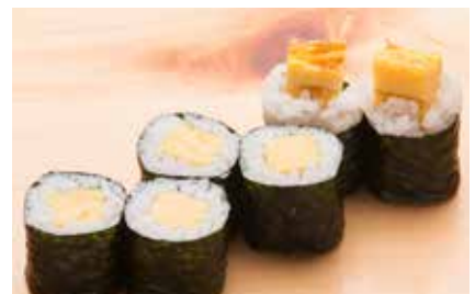
Tamago Maki _____ $6 Omelette Roll たまご巻き