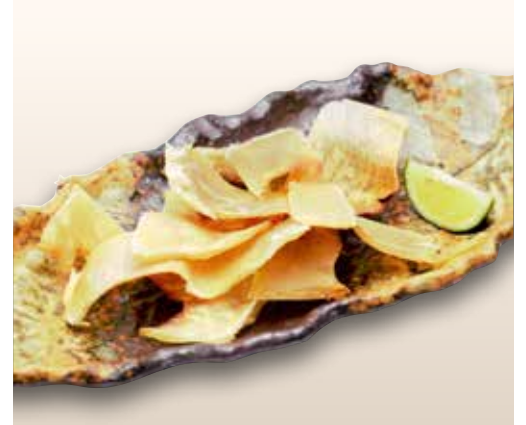
Eihire — $8 Stingray fin えいひれ