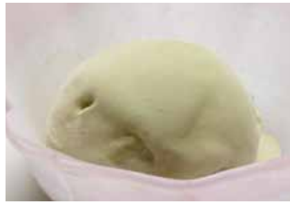
Maccha Ice Cream — $4.2 Green Tea 抹茶アイス