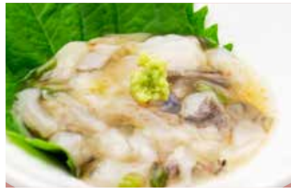
Tako Wasabi — $8 Octopus Marinated with Wasabi たこわさび