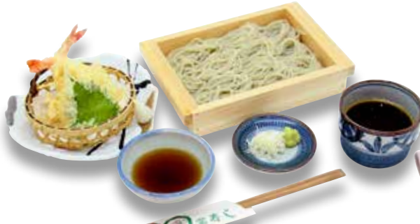
Tem Hegi Soba — $22 Niigata Signature Cold Soba with Assorted Tempura 天へぎそば