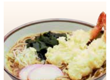
Ebi Tem Soba — $16 Hot Soba with Prawn Tempura えび天そば