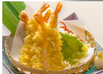
Ebi Tempura ————— $24 Black Tiger Prawn Tempura えび天ぷら