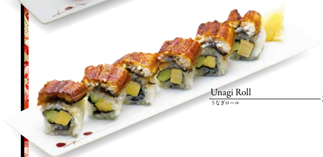
Unagi Roll — $25 うなぎロール