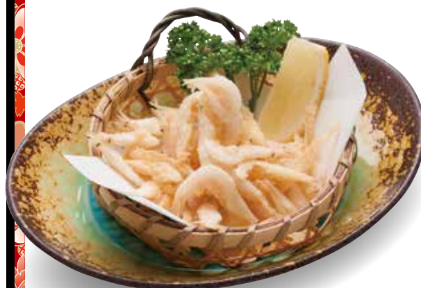
Shiro Ebi Karaage $14 Fried Glass Shrimp 白えび唐揚げ