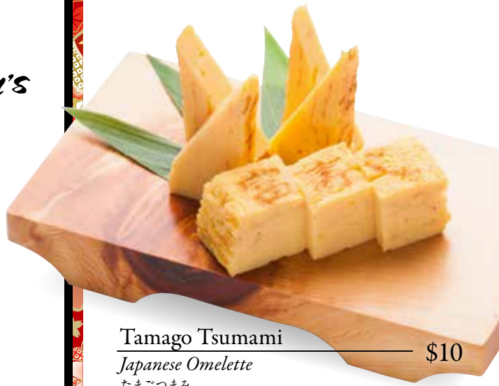
Tamago Tsumami — $10 Japanese Omelette たまごつまみ