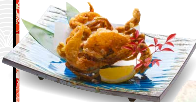
Soft Shell Crab $15 Soft Shell Crab ソフトシェルクラブ