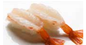
Aka Ebi $8 Red Prawn 赤えび