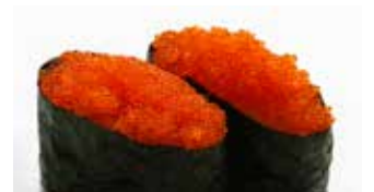
Tobikko $5 Flying fish Roe とびっこ