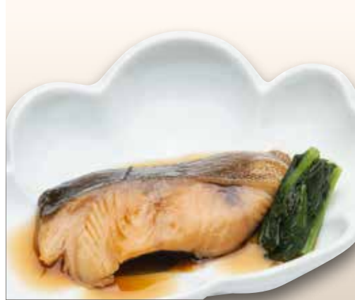
Gindara Nitsuke — $16 Simmered Silver Cod 銀だら煮付け