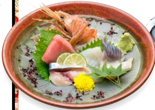
Sashimi 5kinds _____ $34 Assorted Sashimi 刺身5種盛り