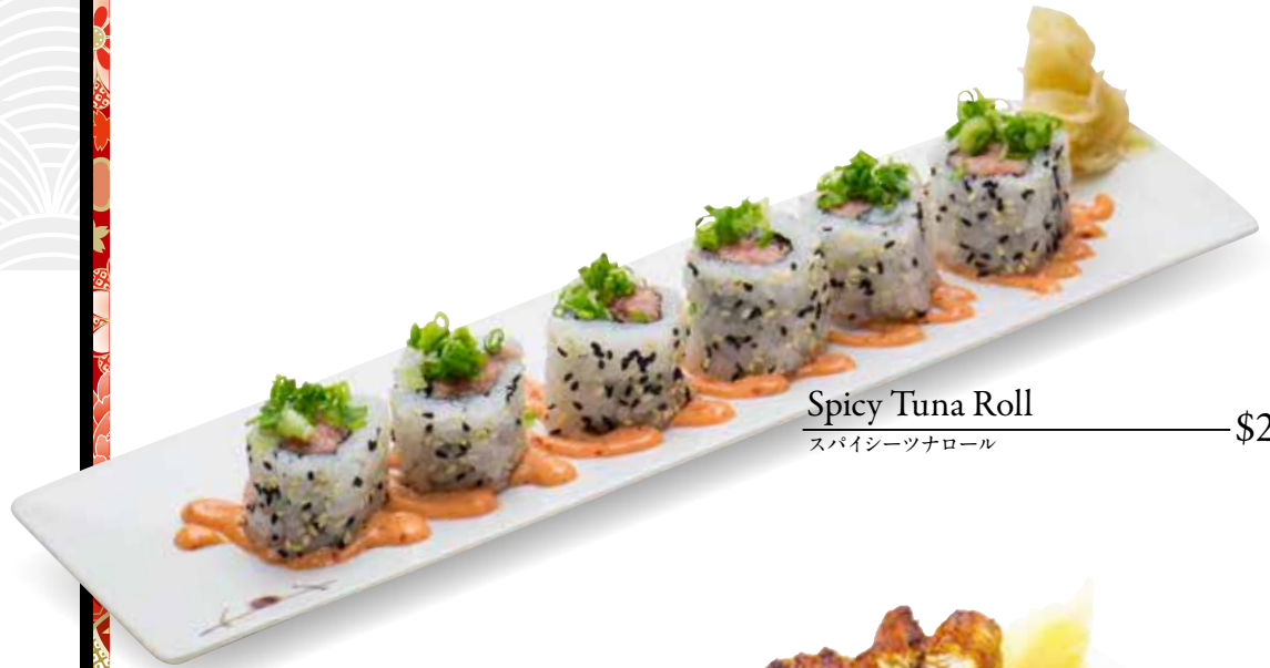
Spicy Tuna Roll — $22 スパイシーツナロール