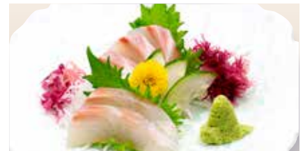
Madai Sashimi _____ $28 Red seabream 真鯛