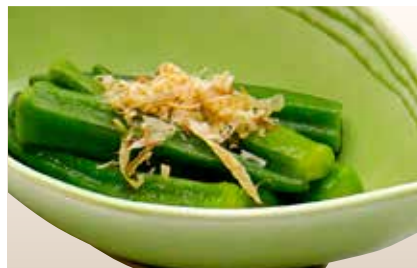
Okura Asazuke — $5 Pickled Ladyfinger オクラ浅漬け