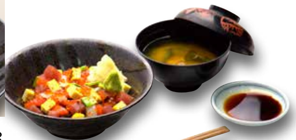
Bara Chirashi — $24 Diced Seafood Don ばらちらし