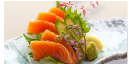
Salmon Sashimi _____ $16 Salmon サーモン