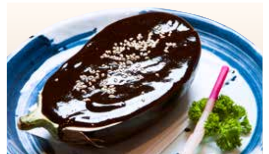
Bei Nasu Dengaku _____ $18 Oval Eggplant 米なす田楽