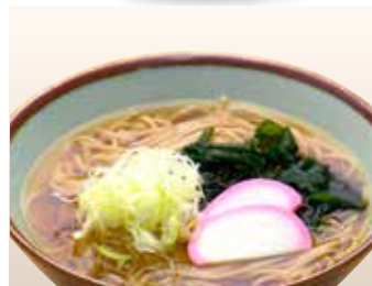
Kake Soba — $9 Plain Hot Soba かけそば