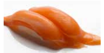
Salmon $7 Salmon サーモン