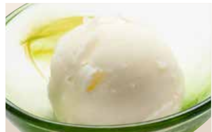
Yuzu Sherbet — $4.2 Yuzu Citrus ゆずシャーベット