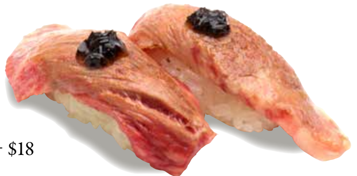
Wagyu Truffle Konbu $18 Seared Wagyu Truffle Konbu 和牛 トリュフ昆布