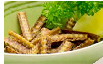
Unagi Bone — $8 Eel Bone うなぎボーン