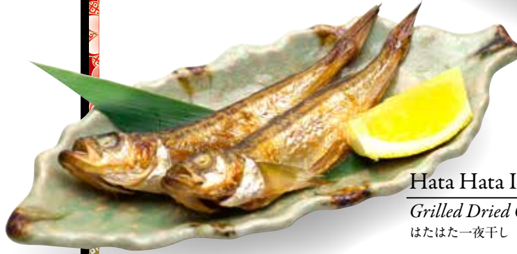
Hata Hata Ichiyaboshi — $14 Grilled Dried Overnight Sandfish はたはた一夜干し