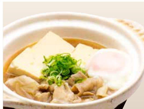
Niku Dofu _____ $18 Black pork and Tofu 肉豆腐