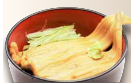
Ni Anago Don — $30 Simmered Sea Eel Don 煮穴子丼