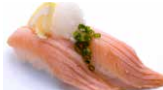
Aburi Toro Salmon Ponzu $8 Seared Salmon 炙りとろサーモン ポン酢