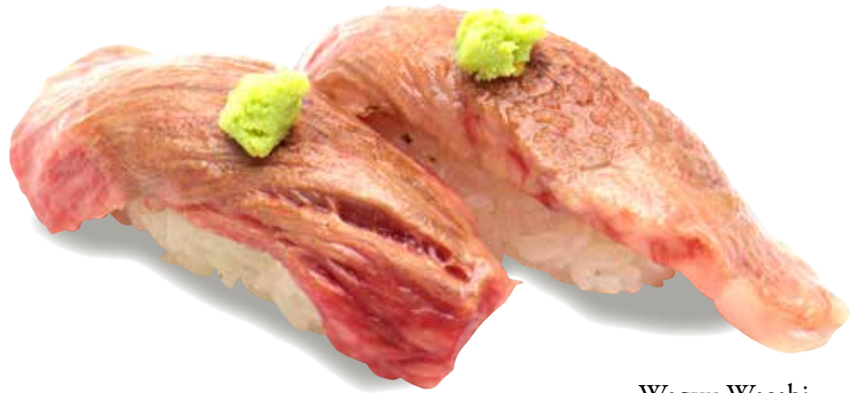
Wagyu Wasabi $16 Seared Wagyu Wasabi 和牛 わさび