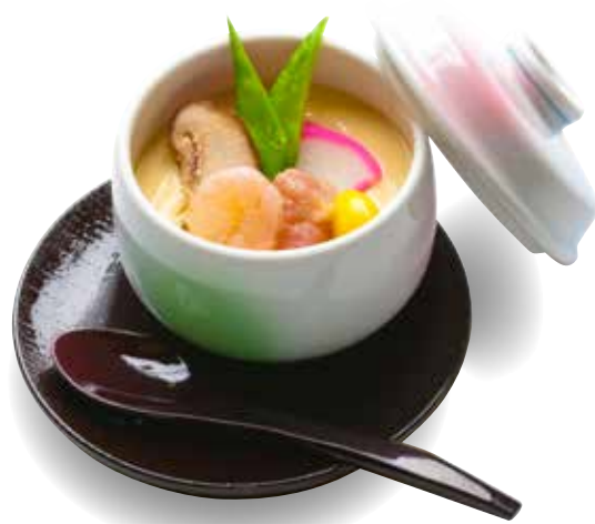
Chawanmushi _____ $6 Japanese Steamed Egg 茶わん蒸し