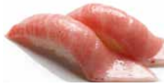
Otoro Fatty Tuna $30 大とろ