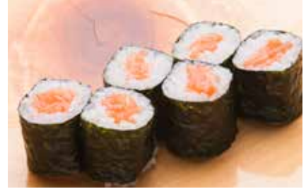
Salmon Maki _____ $8 Salmon Roll サーモン巻き