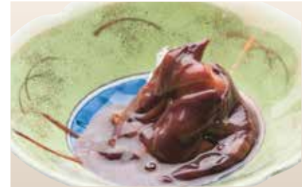
Hotaruika Okizuke — $8 Pickled Firefly Squid ほたるいか沖漬け