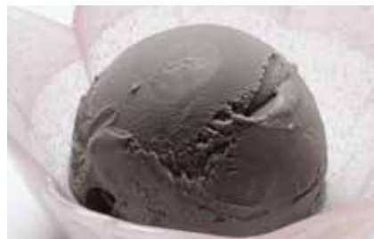
Goma Ice Cream — $4.2 Sesame ごまアイス