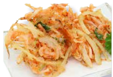
Sakura Ebi Kakiage ————— $12 Cherry Shrimp Kakiage 桜えびかき揚げ