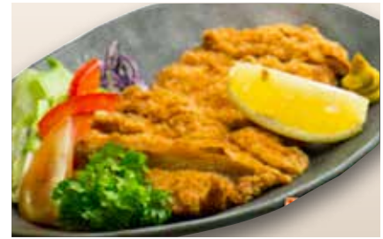
Chicken Katsu $12 Fried Chicken with Bread Crumbs チキンカツ