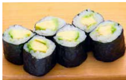
Avocado Maki _____ $6 Avocado Roll アボカド巻き