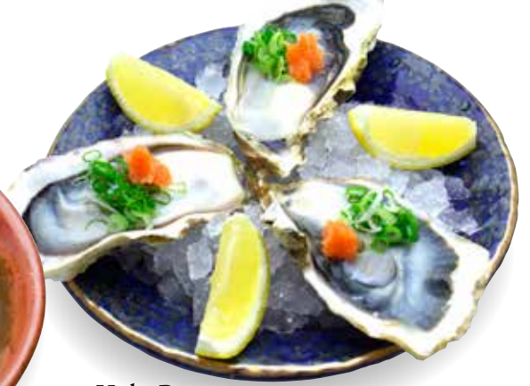
Kaki Ponzu _____ $6/pc Japanese Oyster with Ponzu sauce 牡蠣ポン酢