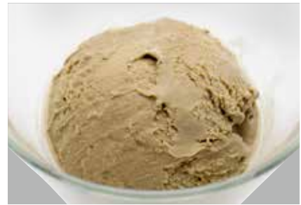
Hojicha Ice Cream — $4.2 Roasted Green Tea ほうじ茶アイス