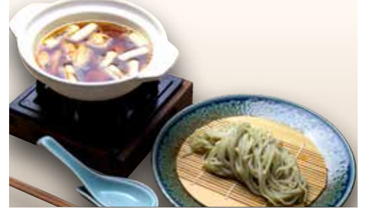
Tori Namban Soba — $14 Cold Soba with Chicken Soup とり南蛮そば