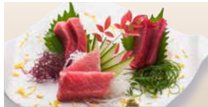
Maguro 3kinds _____ $50 Assorted Tuna Sashimi まぐろ3種盛り