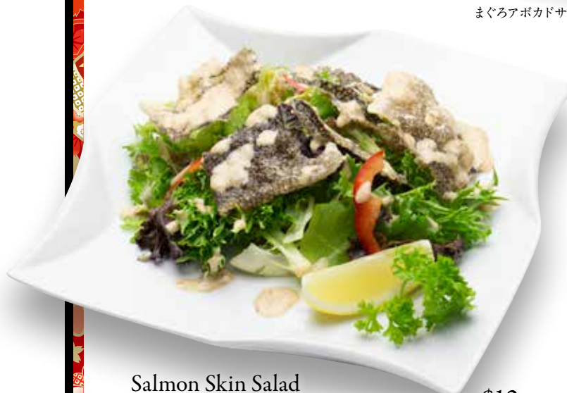
Salmon Skin Salad