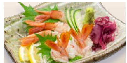
Aka Ebi Sashimi _____ $16 Red Prawn 赤えび