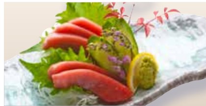
Chutoro Sashimi _____ $40 Medium Fatty Tuna 中とろ