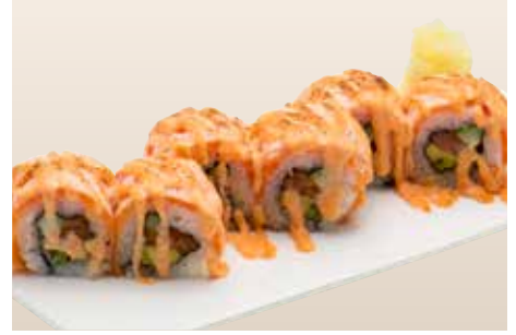
Aburi Salmon Roll — $24 炙りサーモンロール