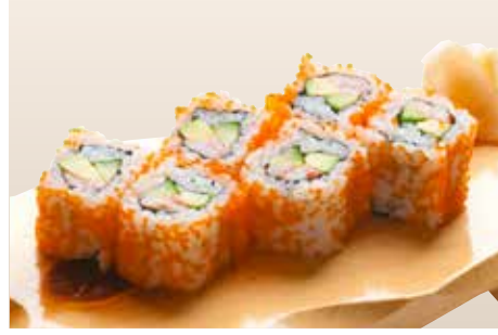
California Roll — $14 カリフォルニアロール