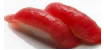
Akami Tuna $8 赤身