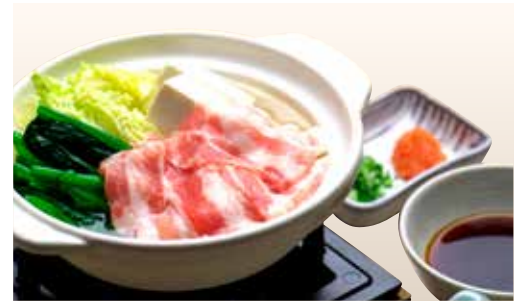
Kurobuta Joya Nabe _____ $20 Kurobuta Pork Hot Pot 黒豚常夜鍋