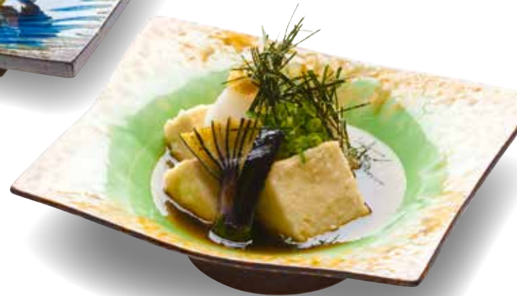
Agedashi Tofu $10 Fried Bean Curd 揚げ出し豆腐