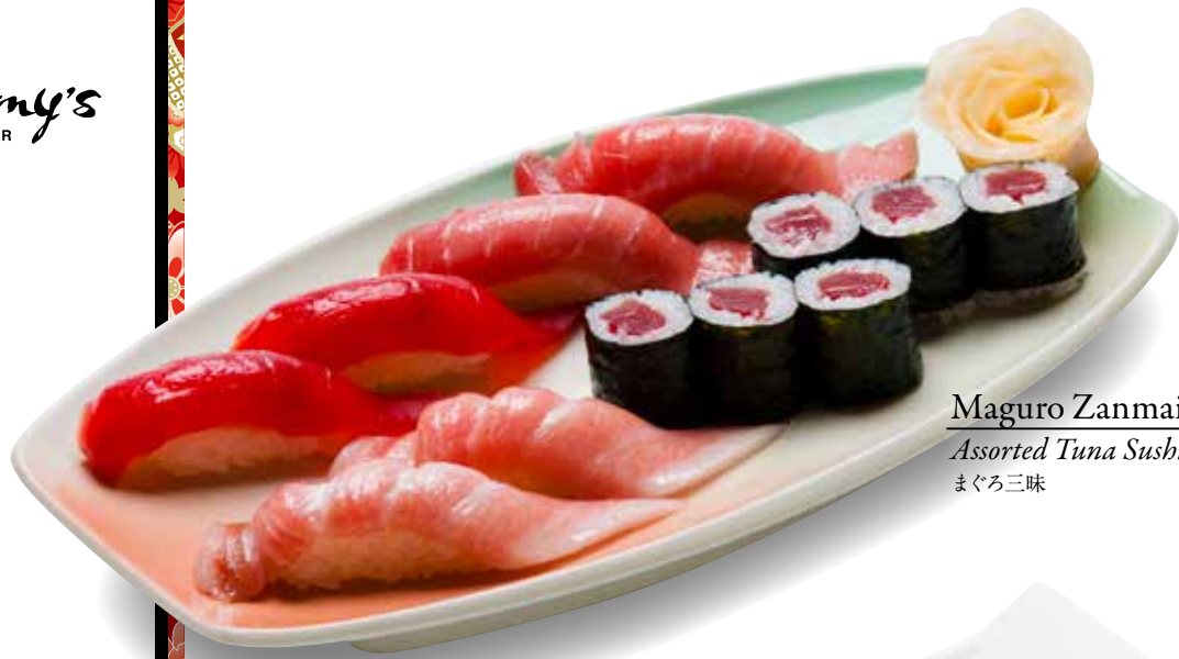
Maguro Zanmai — $65 Assorted Tuna Sushi まぐろ三味