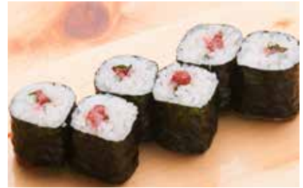
Umeshiso Maki _____ $6 Ume Plum Roll 梅しそ巻き