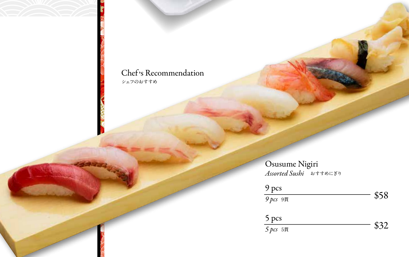
Osusume Nigiri Assorted Sushi おすすめにぎり 9 pcs — $58 9 pcs 9貫