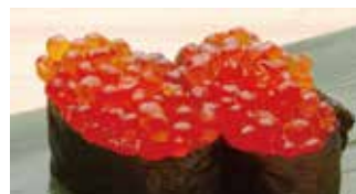
Ikura $12 Salmon Roe いくら