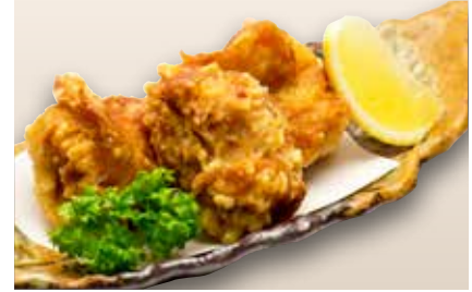
Wakatori Karaage $9 Japanese Fried Chicken 若鶏唐揚げ