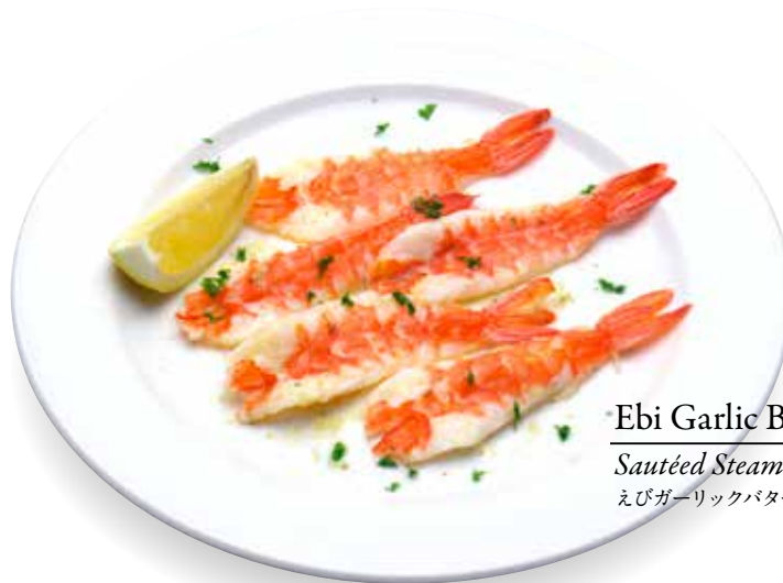
Ebi Garlic Butter — $12 Sautéed Steam Prawn with Garlic Butter えびガーリックバター