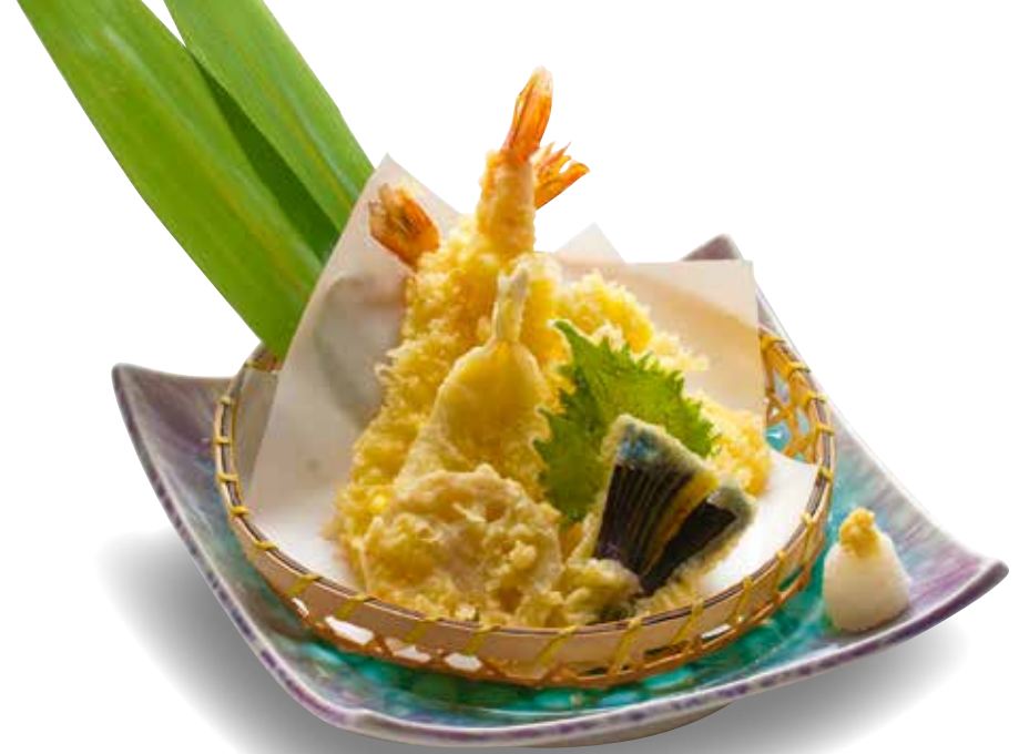
Tempura Moriawase ————— $20 Assorted Tempura 天ぷら盛り合わせ