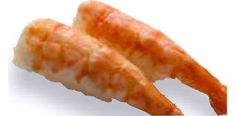
Mushi Ebi $7 Steamed Shrimp 蒸しえび