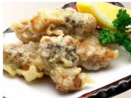
Unagi Tempura ————— $12 Eel Tempura うなぎ天ぷら