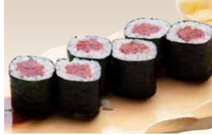
Tekka Maki _____ $8 Tuna Roll 鉄火巻き