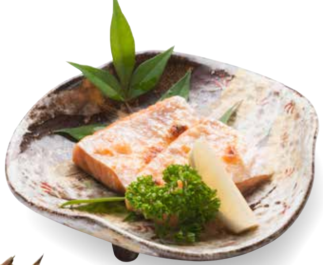
Sake Harasu Shioyaki — $14 Grilled Salmon Belly 鮭ハラス塩焼き