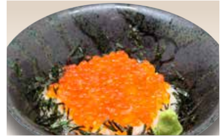
Ikura Don — $37 Salmon Roe Don いくら丼