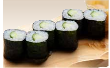
Kappa Maki _____ $6 Cucumber Roll かっぱ巻き