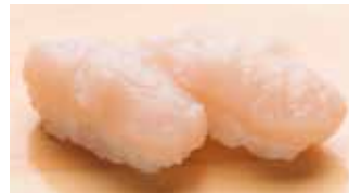
Hotate $9 Scallop ほたて