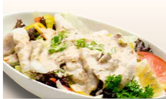
Kurobuta Reishabu Salad