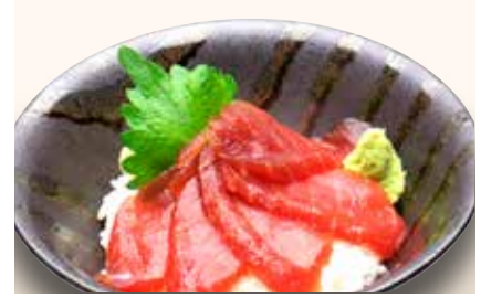
Maguro Zuke Don — $20 Marinated Tuna Don まぐろ漬け丼