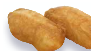
Inari $5 Fried Bean Curd いなり