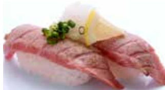
Aburi Toro Oroshiponzu $20 Seared Fatty Tuna 炙りとろ おろしポン酢