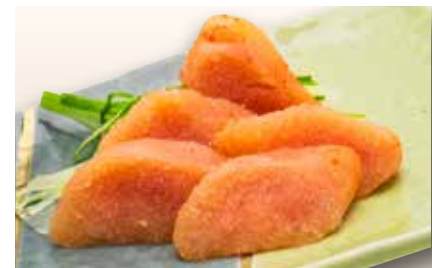
Mentaiko Tsumami (Nama or Aburi) — $10 Spicy Cod roe (Raw or Seared) 明太子つまみ(生 or 炙り)