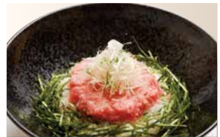
Negitoro Don — $32 Minced Fatty Tuna Don ねぎとろ丼