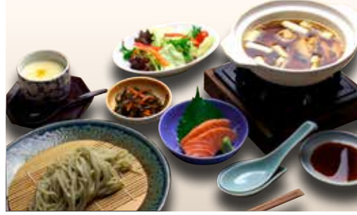
Tori Namban Soba set — $26 Cold Soba with Chicken Soup Set とり南蛮そばセット