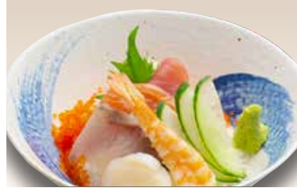
Daily Kaisen Don — $22 (Dinner) Daily Kaisen Don 日替わり海鮮丼