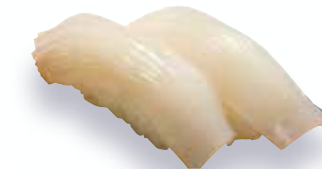
Ika $5 Squid いか