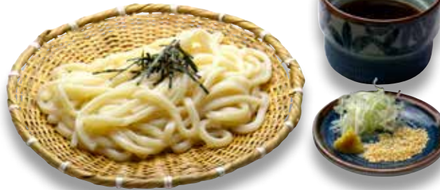
Zaru Udon — $8 Cold Udon ざるうどん