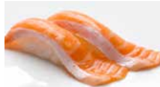
Toro Salmon $10 Salmon belly とろサーモン