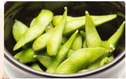
Eda Mame — $7 Edamame 枝豆