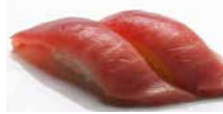
Chutoro Medium Fatty Tuna $20 中とろ