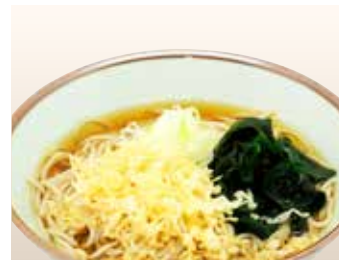
Tanuki Soba — $13 Hot Soba with Tempura Bits たぬきそば