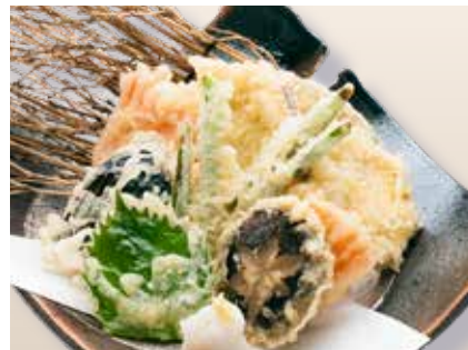
Yasai Tempura ————— $14 Vegetable Tempura 野菜天ぷら