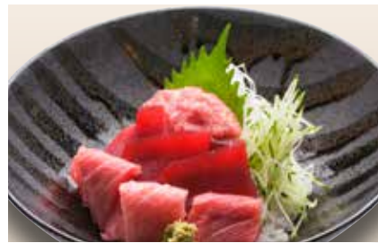
Jo Tekkadon — $58 Assorted Tuna Don 上鉄火丼