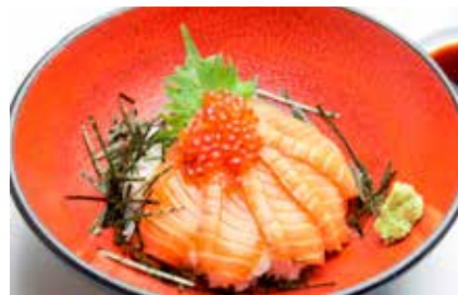
Salmon Don — $22 Salmon Don サーモン丼