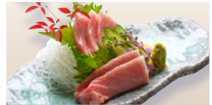
Otoro Sashimi _____ $60 Fatty Tuna 大とろ