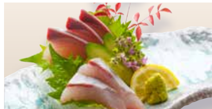
Hamachi Sashimi _____ $28 Yellowtail はまち