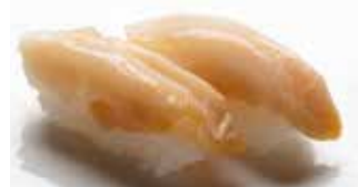
Tsubu Kai $6 Whelk つぶ貝