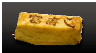
Tamago $5 Japanese Omelette たまご