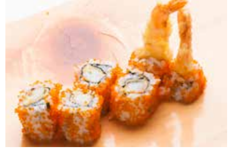
Ebi Tem roll — $18 えび天ロール