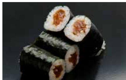
Kampyo Maki _____ $6 Gourd かんぴょう巻き