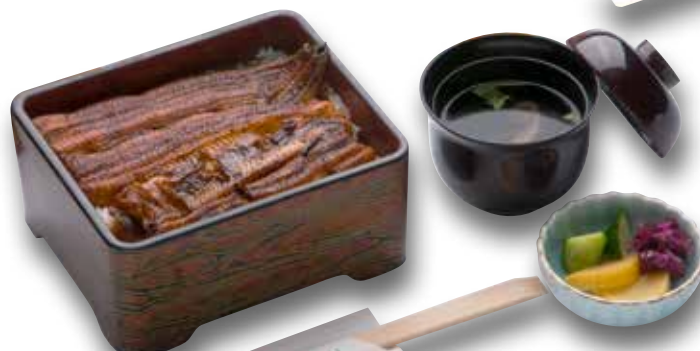
Unaju — $48 Grilled Eel on Rice うな重