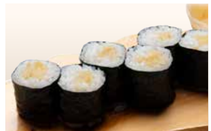
Oshinko Maki _____ $4 Pickles Roll おしんこ巻き