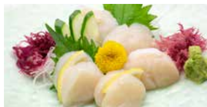
Hotate Sashimi _____ $18 Scallop ほたて