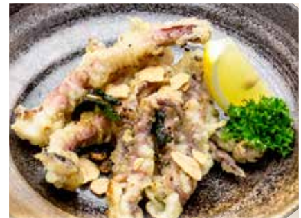
Geso Tem Garlic Butter ————— $15 Fried Squid Tentacles with Garlic Butter げそ天ガーリックバター