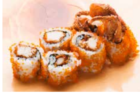
Spider Roll — $18 スパイダーロール