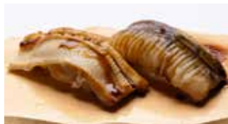
Anago $14 Simmered Sea Eel あなご