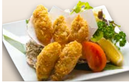
Kaki Fried $18 Fried Oyster カキフライ