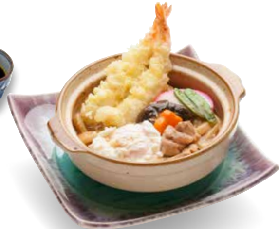
Nabeyaki Udon — $18 Nabeyaki Udon 鍋焼きうどん