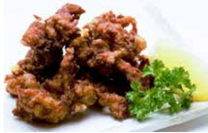
Maguro Suji Karaage $9 Deep Fried Tuna String まぐろすじ唐揚げ