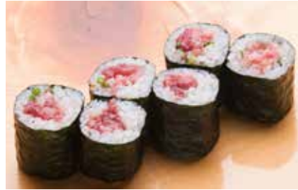
Negitoro Maki _____ $14 Minced Tuna Roll ねぎとろ巻き