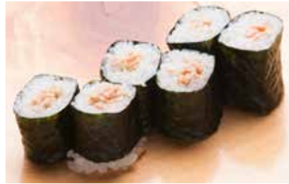
Natto Maki _____ $6 Natto Roll 納豆巻き