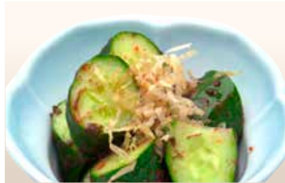
Kyuri Bainikuae — $8 Cucumber with Sweet Salted Plum きゅうり梅肉和え